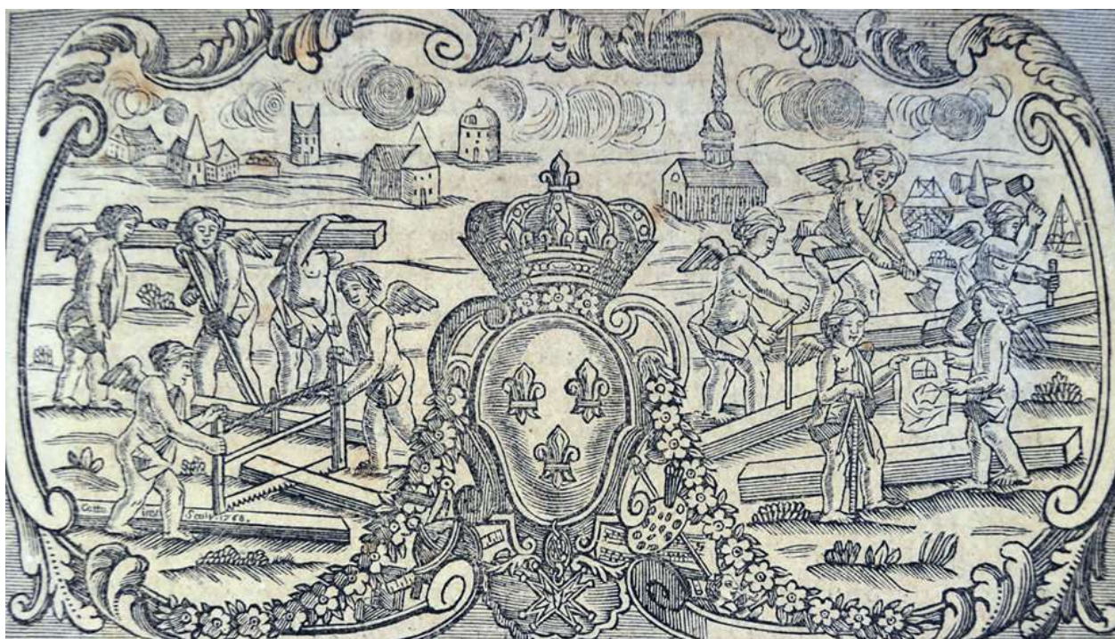
Gravure sur bois servant de bandeau à l'explication de la première planche de "L'Art du trait de charpenterie" (1768) par Nicolas Fourneau, compagnon passant charpentier. Cl. J.-M. Mathonière

Mercredi 5 mai de 9h00 à 12h30 Salle 5.6.